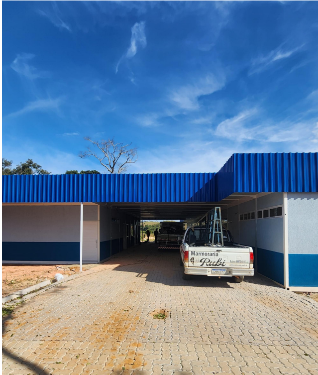
Figura 1 - Entrada do Cemei Cervo.