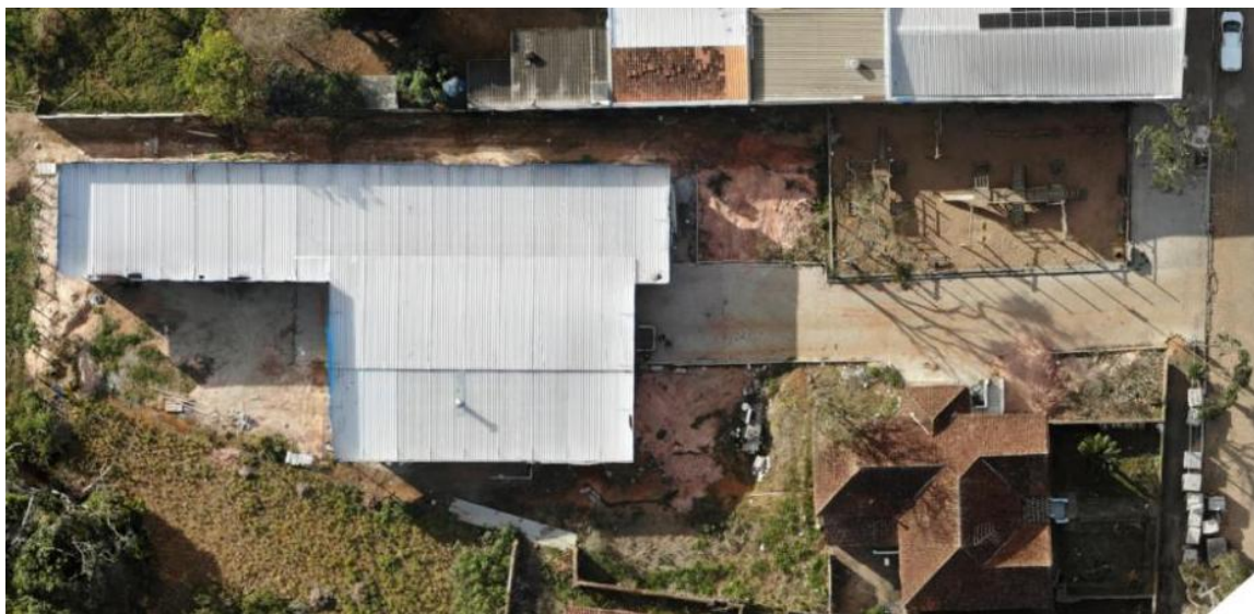
Figura 9 - Orthomosaico do Cemitério Cervo

As fotos do levantamento fotográfico demonstram a situação atual do Cemitério Cervo, sendo tiradas durante o mês de JUNHO 2025.