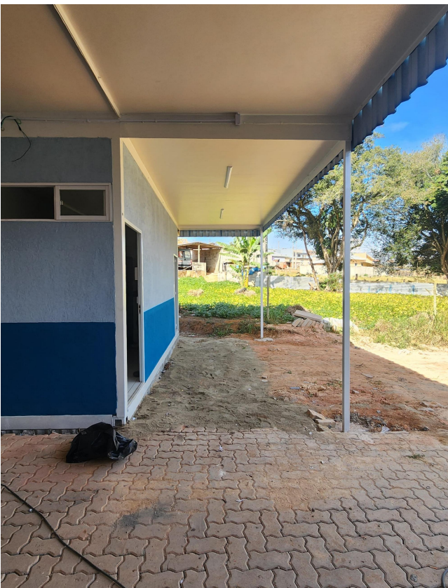
Figura 3 - Vista do Acesso dos Banheiros Masculino e Feminino.