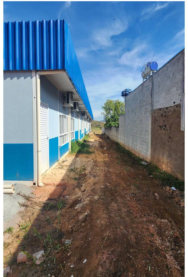
Figura 6 - Vista Lateral dos Módulos de Sala de Aula.