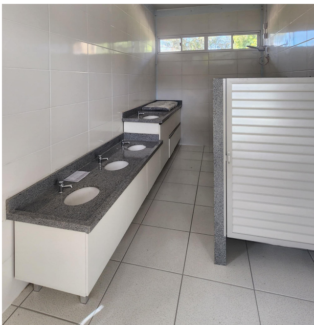
Figura 7 - Banheiros Internos.