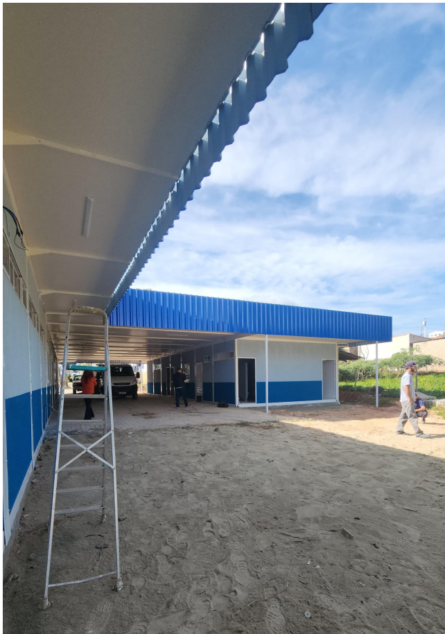
Figura 5 - Acesso das Salas de Aula a Partir do Pátio Interno.