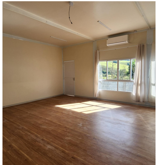
Figura 8 - Salas de Aula Internas.