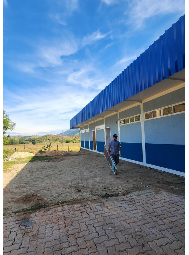
Figura 4 - Vista do Acesso das Salas de Aulas.