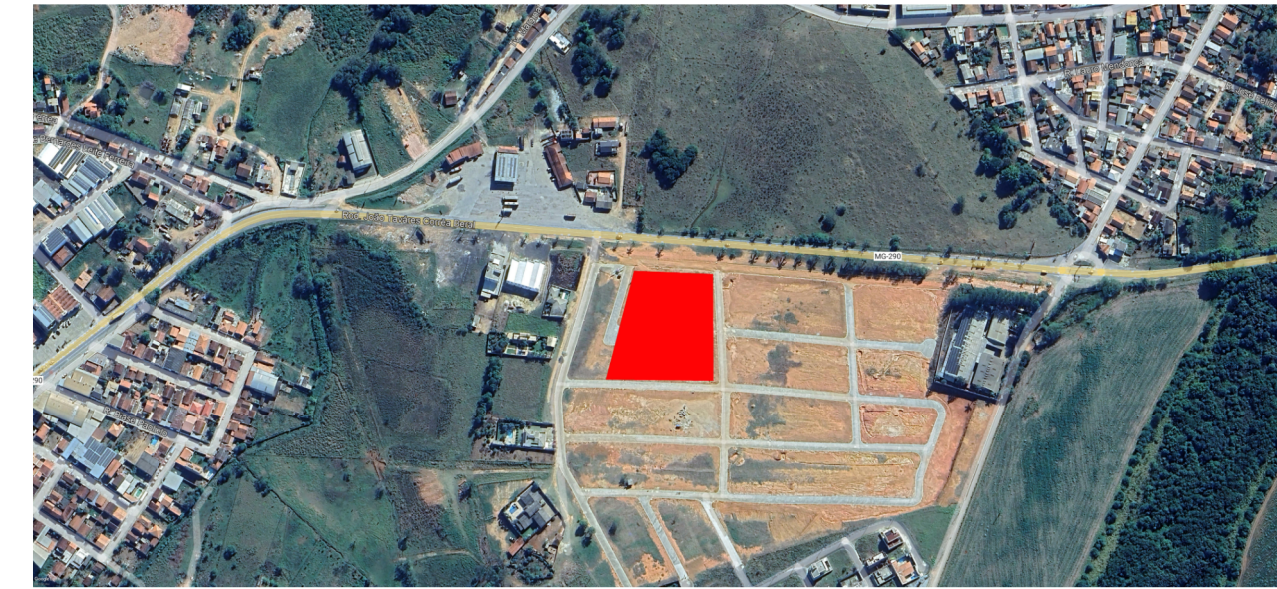
PLANTA DE LOCALIZACAO